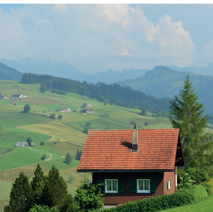
Vue vers le sommet du Hinterfallenchopf.

Restaurant Sternen à Bendel, 071 993 17 02