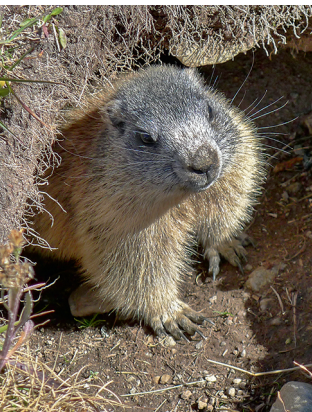
Une marmotte un brin curieuse.

Parc Ela, 081 508 01 12, www.parc-ela.ch Berghaus Val Tuors, 081 404 11 93 Cabane Kesch CAS, cabane: 081 407 11 34, vallée: 081 407 16 97, www.kesch.ch Bus alpin, 081 834 45 34, à réserver au moins une heure avant le départ