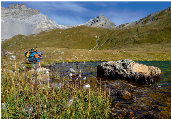
La température du Lai da Ravais-ch Sur? Mieux vaut le contempler.