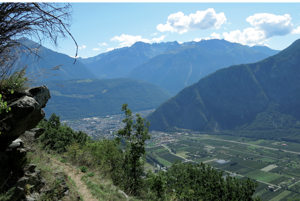
À la fin de la montée, le randonneur a une vue imprenable sur le coude du Rhône.

Pavillon agritouristique Fol'terres, 027 746 13 13, www.folterres.ch