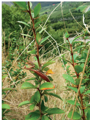
Un bon camouflage: la mante religieuse adapte sa couleur.