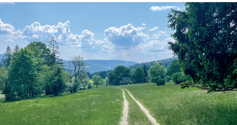
Un paysage jurassien typique: prairies, pâturages et forêts clairsemées.

Restaurant Arena, Tramelan, 032 487 41 01, https://restaurantarena-tramelan.ch/