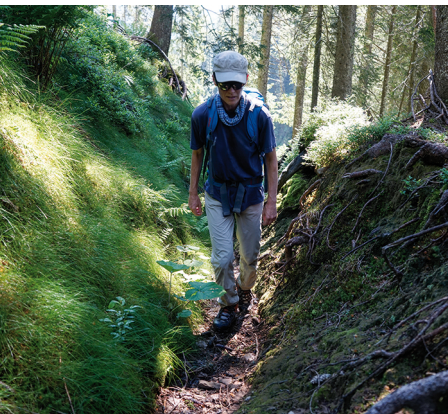
Le décor change du tout au tout: voilà un chemin creux dans la forêt.

La randonnée peut être raccourcie d'une heure environ en prenant le TaxiAlpin entre Gfellen et la région de Grund. Speedy Taxi: 079 762 80 15.