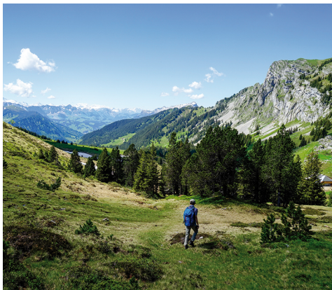
Derrière le Wasserfallennegg se déploie la vallée du Grönbach.