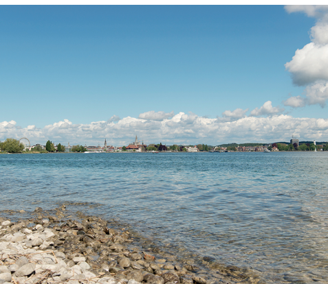
Au loin, Constance et sa grande roue.

Restauration et hébergement sur la rive du lac, à Kreuzlingen ou à Constance.