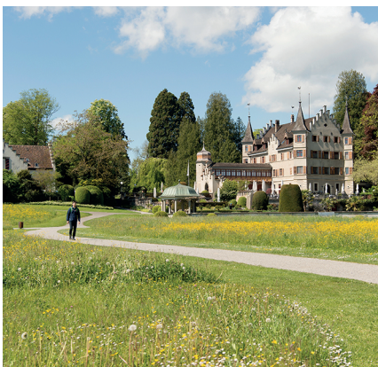
Le Seeburgpark à Kreuzlingen est le plus grand parc public au bord du lac de Constance.