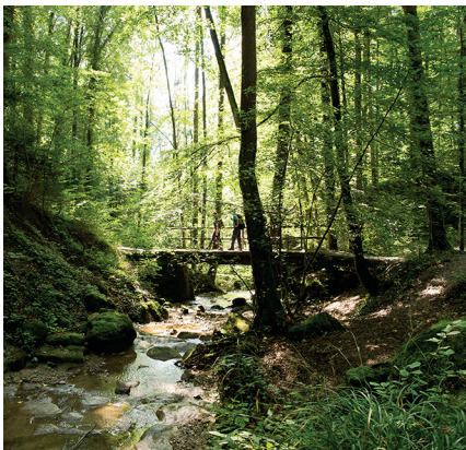
Par des sentiers tortueux et des ponts dans la gorge du Dorfbach.