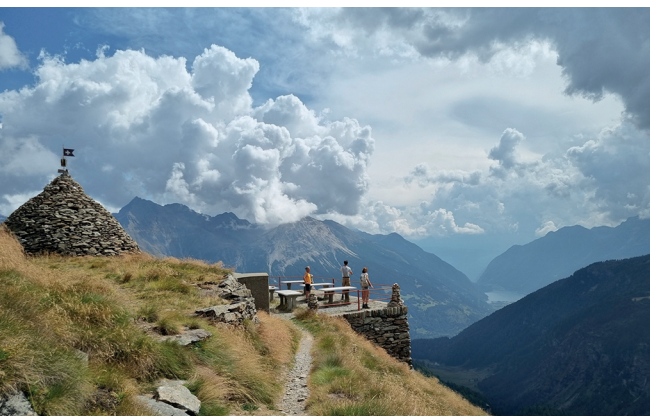
Depuis le point de vue de Sassal Mason, le panorama s'étend jusqu'au val Poschiavo.

On accède à Cavaglia et «Ospizio Bernina» en train depuis Poschiavo ou Saint-Moritz. Hôtel-restaurant Stazione Cavaglia, Poschiavo, 081 834 61 55, www.stazionecavaglia.ch Restaurant Alp Grüm, Poschiavo, 081 844 03 18, www.alpgrum.com