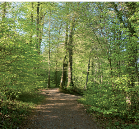
Les cimes des arbres forment une cathédrale naturelle.

On accède Bremgarten et Hedingen par RER depuis Zurich, Zoug, Wohlen et Aarau.