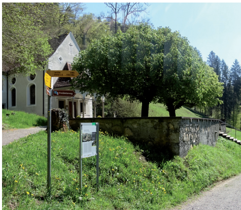
Surprise en pleine forêt : la chapelle Jonental.