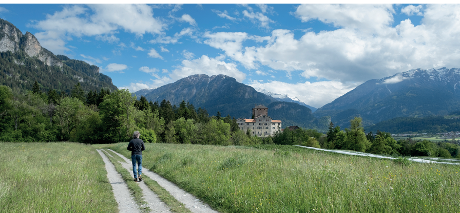
L'imposant château de Rietberg, où Jörg Jenatsch assassina le noble Pompejus von Planta au XVIIe siècle.

Burgenweg Domleschg, www.spazierwege.ch Biohof Dusch, 081 655 10 19, www.hof-dusch.ch Canovasee, 076 445 28 74, www.canovasee.com Casa Caminada, Fürstenau, 081 632 30 50, www.casacaminada.com