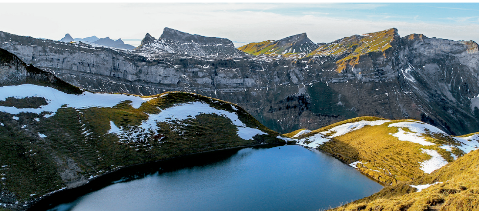
Splendide vue, depuis le Sihlseeli, sur les Pfannenstöckli, Schülberg, Fidisberg et Biet (de g. à d.).

Accès pour les groupes depuis le Muotathal par le col de Prigel: Alpen-Taxi Prigel-Garage, Muotathal, 041 830 11 81