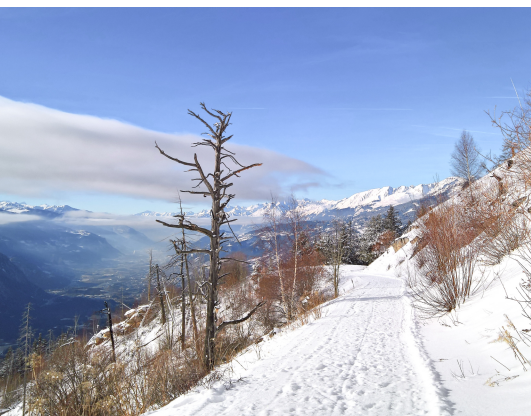
Des arbres carbonisés rappellent l'incendie de l'été caniculaire de 2003.

Office du tourisme de Loèche-les-Bains, 027 472 71 71, www.leukerbad.ch Restaurant Sunnublick Albinen, 027 473 13 87, www.sunnublick.ch