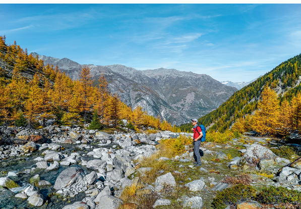
Couleurs automnales dans la montée vers la porte du glacier.

Hôtels et restaurants à Grächen et Gasenried