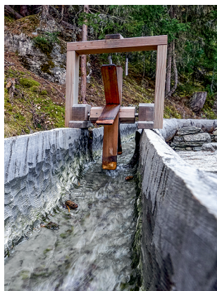
Le marteau de la roue à eau annonce que de l'eau coule dans le bisse.