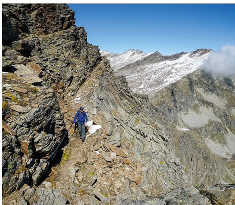
Sur le passage exposé vers le Jazzilücke.