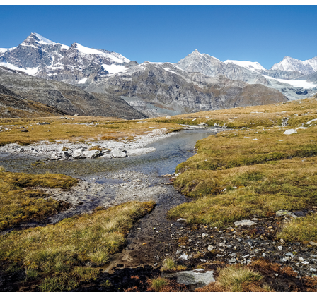
Une vue majestueuse sur l'Ofental et les sommets de plus de 4000 m.

On accède à Saas-Almagell, Dorfplatz avec le car postal de la gare de Viège via Saas-Grund (changer de bus). Prendre le premier télésiège jusqu'à Furggstalden, marcher dix minutes jusqu'au second télésiège, qui mène à Heidbodme. Prendre le car postal à Mattmark via Saas-Grund et descendre à Viège.