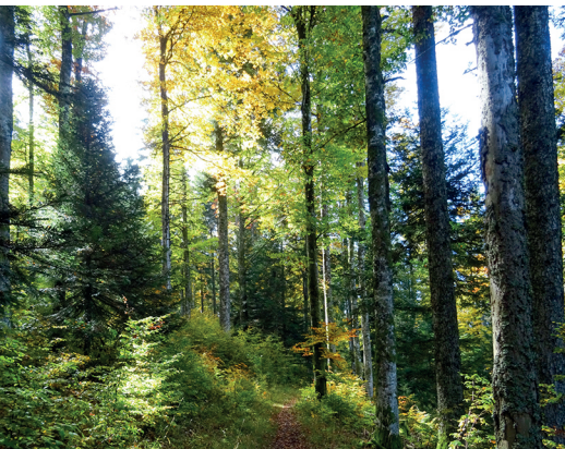
Dans la descente: cette forêt mixte est mieux protégée contre les tempêtes qu'une forêt d'épicéas.

Hôtel-Restaurant L'Auberge de Noiraigue, 032 566 13 60, www.aubergedenoiraigue.ch Ferme Restaurant le Soliat, 032 863 31 36 Restaurant Les Plânes, 032 863 11 65 Restaurant Café des Mines, 032 864 90 64, www.mines-asphalte.ch