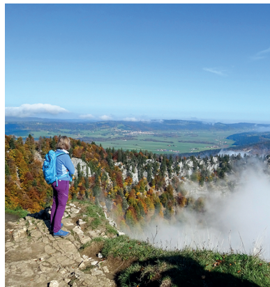
Derrière les rochers du Creux du Van s'étend la haute Vallée des Ponts.