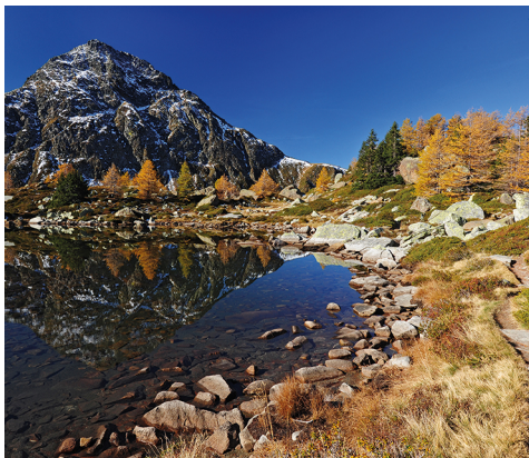
Le lac de Mässersee.