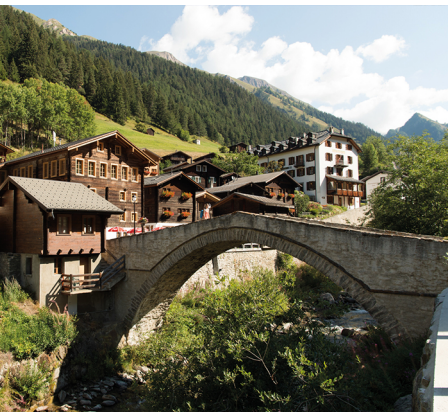
Le pont traverse la rivière Binna.

On accède à Binn en Bus depuis Fiesch VS. Landschaftspark Binntal, www.landschaftspark-binntal.ch