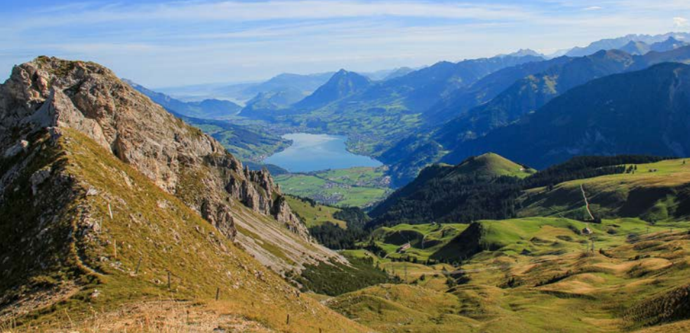
Vue dans la descente du H6ch Gumme vers la Dundelegg sur la vall6e de la Sarneraa.