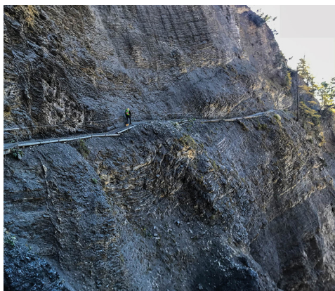
Il est recommandé de ne pas s'arrêter sur ce passage.