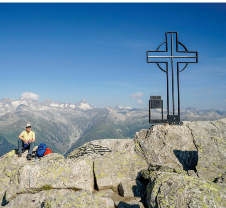
Vue du sommet sur les Alpes bernoises.

On trouve différents hôtels et restaurants à Ulrichen, Geschinen, Münster et à d'autres endroits de la vallée de Conches. Office du tourisme d'Obergoms: tél. 027 974 68 68, www.obergoms.ch