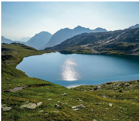
Le lac de Distel et, derrière lui sur la gauche, le col du Nufenen.