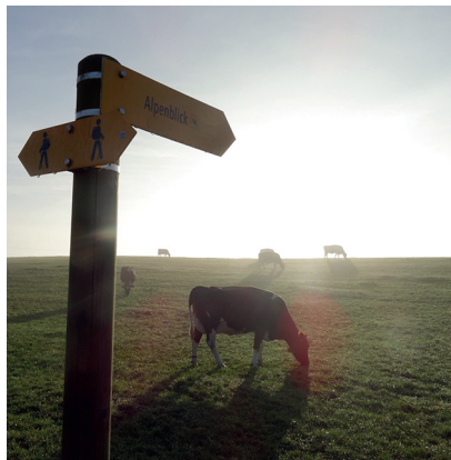
Les vaches apprécient-elles aussi le paysage lorsque le brouillard se lève?