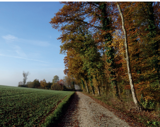
Les vaches apprécient-elles aussi le paysage lorsque le brouillard se lève?

On accède «Hallau, Gemeindehaus» en bus depuis «Wilchingen-Hallau» et en train depuis Schaffhausen. À Trasadingen, on peut prendre le train à Schaffhausen.