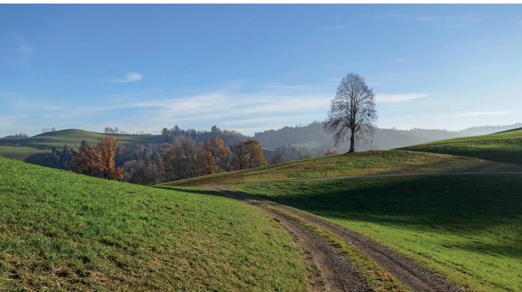
Les collines arrondies font le charme de cette région.

Gasthof zu den Alpen, Eriswil, 062 966 18 47, http://gasthof-alpen.ch/