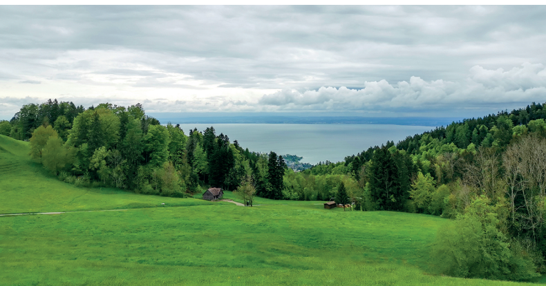
Vue sur le lac de Constance.

Restaurants à Goldach et à Heiden. Kaienhaus (ouvert le week-end et sur demande), 071 870 07 23, www.kaienhaus.ch