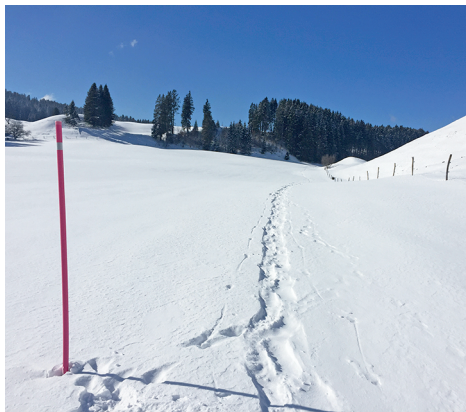
Un agréable chemin jusqu'au Mont des Cerfs.