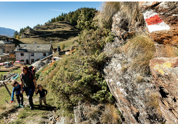
Le Chemin des charbonniers débute au-dessus de San Romerio.

Alpe San Romerio, 081 846 54 50, www.sanromerio.ch