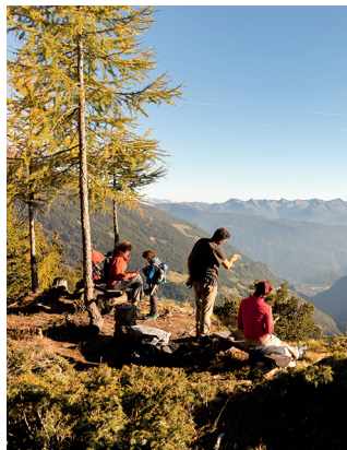
Le point le plus élevé offre une vue jusqu'aux faubourgs de Tirano.