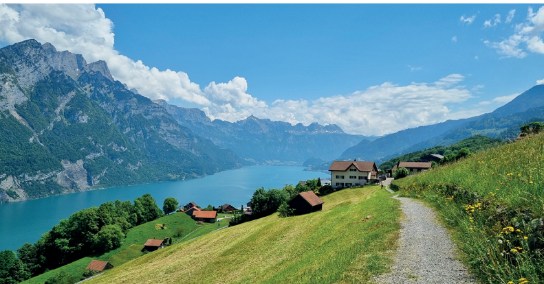
Panorama impressionnant au-dessus du lac de Walenstadt.

Gasthof Hirschen, Obstalden, https://hirschen-obstalden.ch/