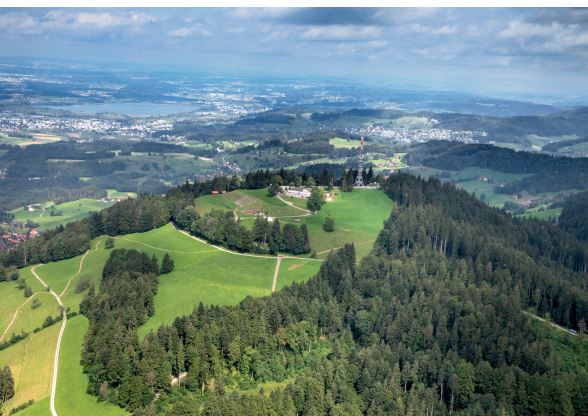
Photo aérienne du Bachtel. Depuis la tour, la vue est tout aussi magnifique.

Confiserie Volland, Steg, 055 265 11 30,