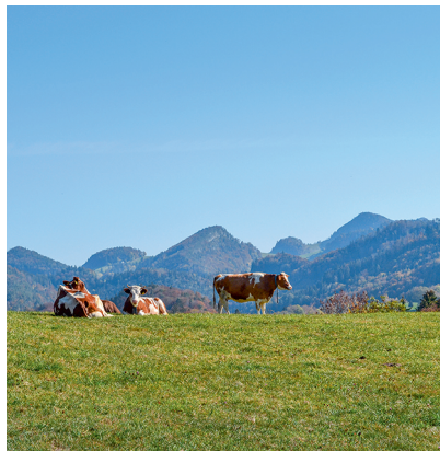
Les randonneurs ne sont pas les seuls à aimer l'automne.