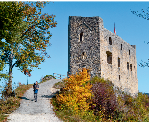
La ruine du château de Gilgenberg surplombe Zullwil.

Restaurant Gilgenberg, Zullwil, 061 791 03 20 Restaurant Meltingerberg, 061 791 03 04 Weisses Kreuz, Breitenbach, 061 781 50 40, www.kreuz-breitenbach.ch