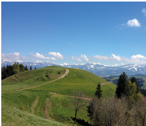
Vue sur le Titlis, au loin.