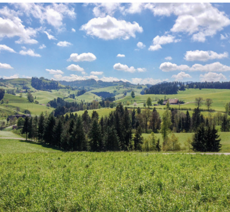
Un charmant paysage vallonné.

On accède Willisau en train via Lucerne et Langenthal.