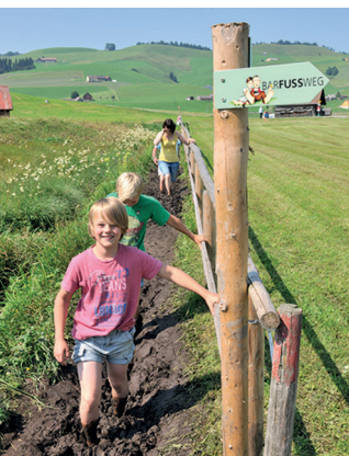
Dans la région du marais, la boue fait des heureux.