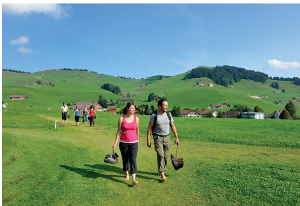
Chaussures à la main, et c'est parti!