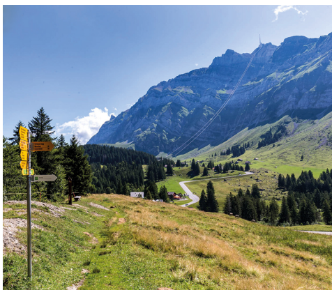
À Schwägalp, vue sur le Sântis à l'arrière-plan.