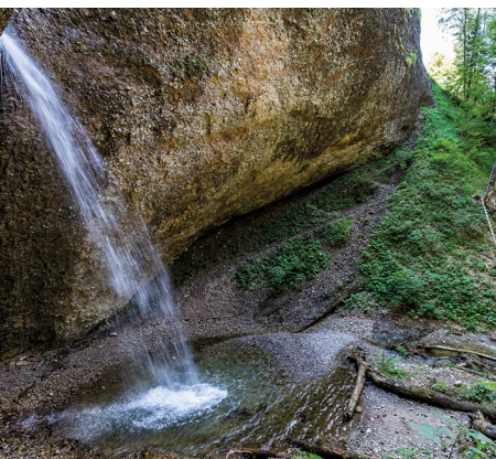
Dans les gorges d'Ofenloch. Le Necker se jette du haut des falaises.

On accède à Seebensäge en car postal depuis Nesslau-Neu St. Johann. Le car repart de Schwägalp, Passhöhe.