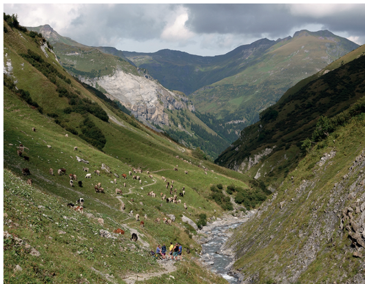
La descente vers Vorsiez est en pente douce.