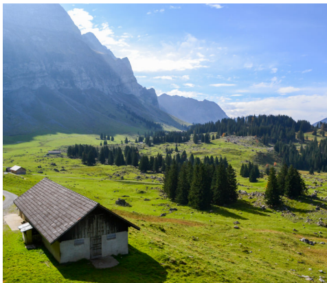
On marche devant des maisons ravissantes et sur des crêtes offrant un panorama grandiose.