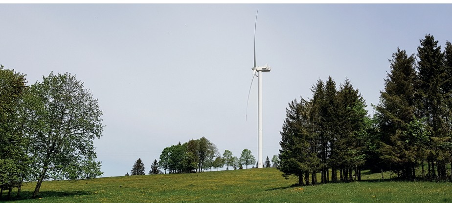
Les imposantes éoliennes sont plus hautes que la collégiale de Berne ou la Prime Tower de Zurich.

Restaurant Le Manoir, Mont-Soleil, 032 941 23 77, www.restaurantlemanoir.ch Hôtel-Restaurant de la Balance, Les Breuleux, 032 954 14 13 Boulangerie et Tea Room Haengggi, 032 487 41 67