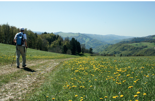
Après le lieu-dit Roc de l'Autel, on entame la descente vers Saint-Ursanne.

Hôtel-restaurant de la Caquerelle, 032 426 66 56, www.lacaquerelle.ch