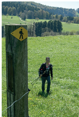
Peu avant le col des Rangiers.