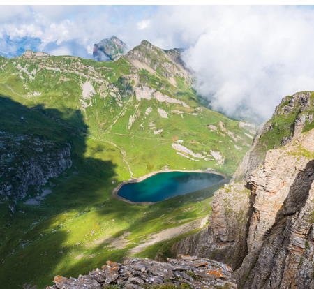
Vue plongeante sur le Spilauer See.

On accède Gitschen en téléphérique depuis Riemenstalden Chappeliberg. Les réservations par car postal de Sisikon à Riemenstalden sont obligatoires.