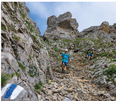
Le chemin descend par un couloir relativement pentu.