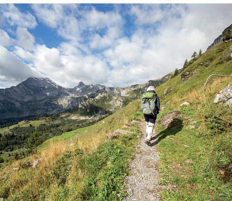
Ascension vers Bützi. L'imposant sommet à gauche est l'Ortstock.

Vente de fromage de brebis et de chèvre sur le Charetalp