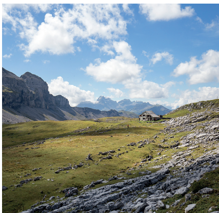
L'itinéraire traverse l'Alp Erigsmatt et le Charetalp.