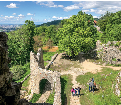
Les ruines de Dorneck promettent de belles découvertes et parties de cache-cache.

Ermitage Arlesheim, www.ermilage-arlesheim.ch Restaurant Schlosshof, 061 702 01 50, www.schlosshof-dornach.ch/