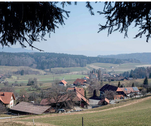
Vue sur le village de Schiltwald depuis Schweikhof.

Musée du tissage et de la région (Weberei- und Heimatmuseum Ruedertal), www.webereimuseum.ch