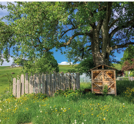
De beaux jardins de ferme, ici avec un hôtel d'insectes, longent le chemin.

Le couvent de Wonnenstein avec une petite boutique: www.schlatt-haslen.ch/kloster-wonnenstein