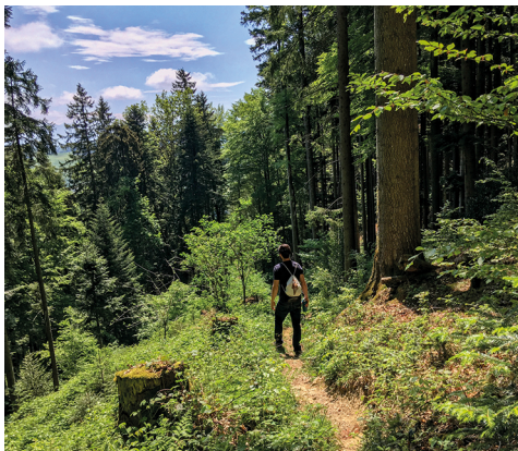
A travers la forêt, le chemin mène à la vallée.