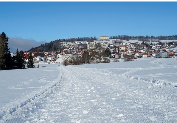
Au Noirmont, il est possible de se restaurer.

Restaurants au Noirmont et à Saignelégier