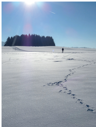
En arrière-plan, les éoliennes tournent.