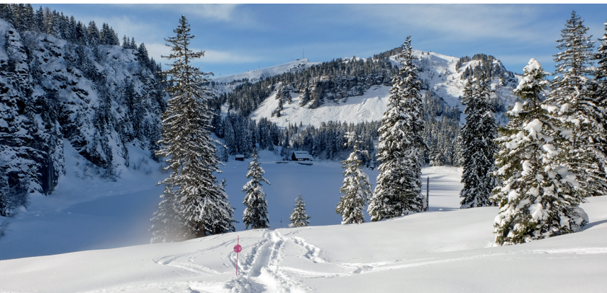
Le lac des Chavonnes, perle gelée des Alpes vaudoises durant l'hiver.

Hôtel Restaurant du Lac, 024 495 21 92, www.bretaye.ch