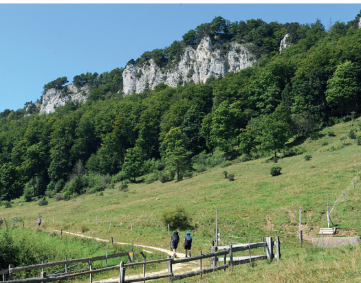
La seconde partie de la randonnée mène sur la chaîne rocheuse du Chamben.

Auberge de montagne Hofbergli, Farnern, 032 637 15 03, www.bergwirtschaft.hofbergli.ch