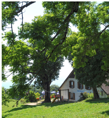
Depuis la terrasse ensoleillée du Hofbergli, il est possible d'apercevoir les Alpes par beau temps.