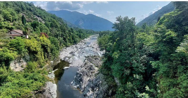
Vue du Ponte dei Cavalli sur le confluent de la Melezza et de l'Isorno.

Osteria all'Orrido di Buvoli Gian Luca, Ponte Brolla, 091 780 73 77, www.osteriaorrido.com