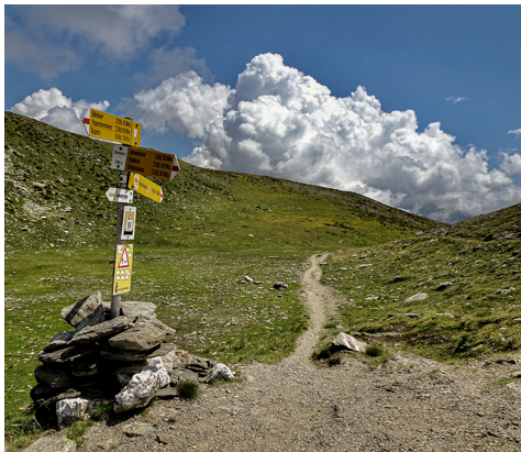
Auf dem Bistinenpass.