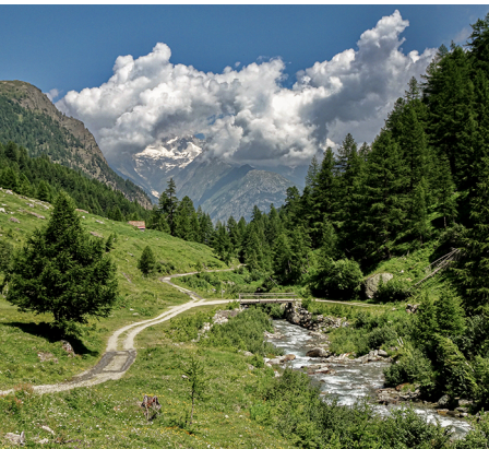
Beim Überqueren der Gamsa im Nantztal.

Simplon-Hospiz, 027 979 13 22, www.gsbernard.ch/simplon