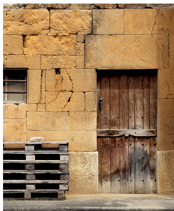
Le case dei viticoltori sono costruite in pietra calcarea di Hauterive.