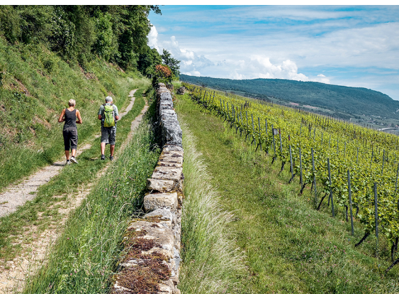
Il sentiero costeggia i vigneti fra Cornaux e Cressier.

Museo archeologico Laténium, Hauterive, 032 889 69 17, www.latenium.ch Hotel Garni Villa Carmen, La Neuveville, 032 751 23 69, www.villacarmen.ch