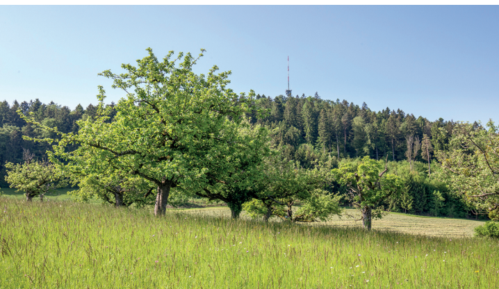
Der Irchelturm im Aufstieg von Buch am Irchel aus gesehen.

Buch am Irchel, 052 318 14 27, www.buchamirchel.ch