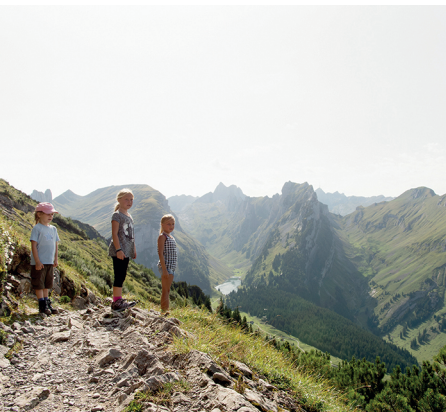
Der Weg ist breit und eignet sich gut für Kinder. Im Hintergrund der Fählensee.

Gasthaus Ruhesitz, 071 799 11 67 www.ruhesitz.ch