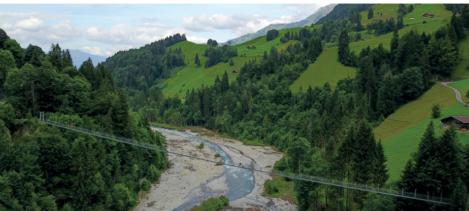
Il ponte sospeso Hostalde sovrasta il largo alveo del fiume Entschlige.

Hängebrügg-Beizli bei Hostalde, 033 671 15 83