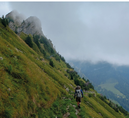
Entlang der steilen Ostflanke des Cap au Moine geht es nun Richtung Col de Jaman.

Erreichbar ist Montbovon mit dem Zug von Bulle FR oder Zweisimmen BE.