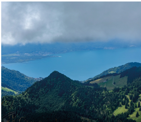
Auf dem Pässlein angekommen, bietet sich ein ganz anderer Blick: der Genfersee.