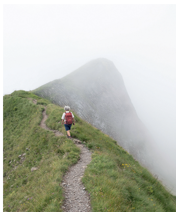
Wandern in luftiger Höhe über den Brisens zur Bergstation Haldigrat.