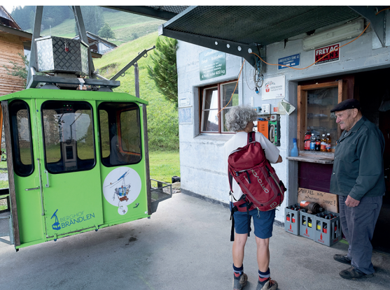
Die Wanderung beginnt mit der Fahrt auf die Brändlen. Eine Seilbahnkabine ist grün, die andere blau.

Sesselbahnen: www.kleinseilbahnen.ch . Für die Bahnfahrten genügend Kleingeld oder kleine Noten mitnehmen.